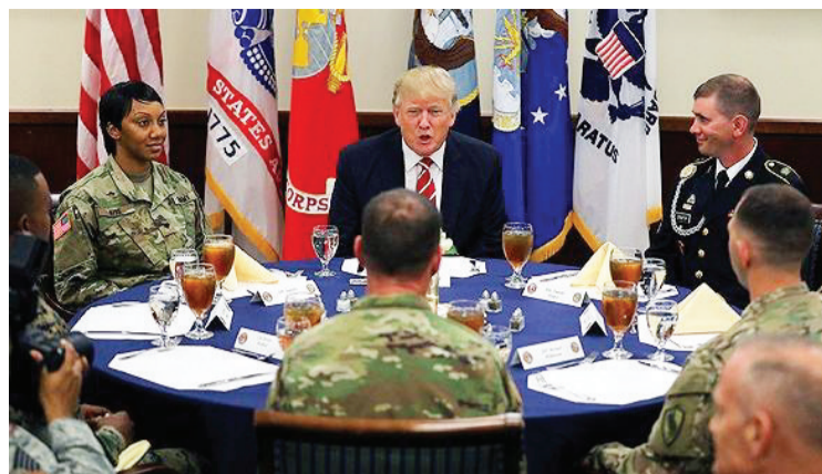
2017年,特朗普视察美军中央司令部和特种作战司令部。

备忘录说,这次阅兵“只使用轮式车辆,不用坦克——必须考虑把对(道路等)基础设施的破坏降至最低”。阅兵式收尾部分将“大量使用飞机”,意味着届时将有多个飞机编队低空飞行。不过,备忘录没有提及阅兵展示的具体武器种类。为纪念美国独立战争以及历次重大战争,美军士兵将穿着不同战争时期的军装,出现在各个方阵中。另外,女兵方阵将获得“重点关注”。参谋长联席会议可望根据这些指导方针,策划具体阅兵方案,例如需要将阅兵式与华盛顿每年例行的退伍军人游行活动整合到一起。承担阅兵任务的则是北方司令部官兵。备忘录没有提及阅兵费用。白宫行政管理和预算局局长米克·马尔瓦尼上月估算,大阅兵预计耗资1000万美元至3000万美元。