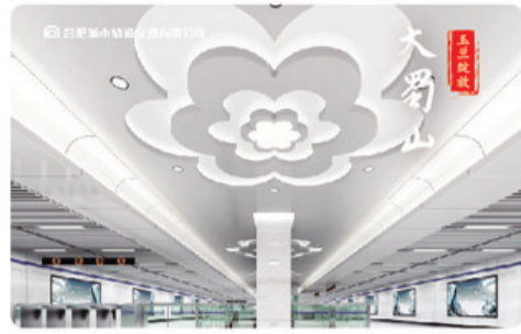
“玉兰绽放”大蜀山站