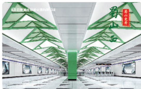
“蜀山竞秀”蜀山西站