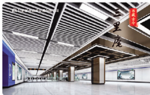
“书藏古今”三里庵站

新版储值票以“合肥剪影”为设计理念,将合肥特色地标建筑用黑白剪影的方式表达出来。储值票8折销售,购买时每张另收押金10元。储值票可反复充值,充值时仍享8折优惠。