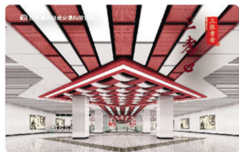
“三张孝母”三孝口站