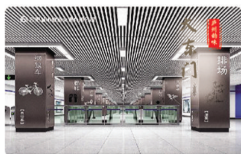
“庐州韵味”大东门站