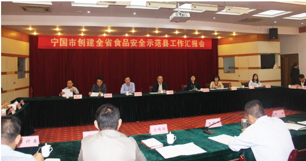
宁国市创建食品安全示范县工作汇报会

让老百姓吃得放心,买得安心。这一切都得益于安徽大力推进“食品安全示范县”创建评估工作的开展。创建是一场“考试”,是一项全民受益的民生工程,这也意味着创建必然是“牵一发而动全身”的系统工作。