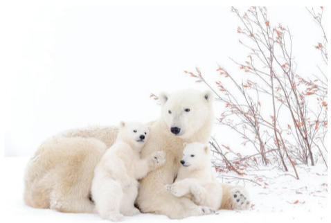
哺乳动物组荣誉奖：一家人