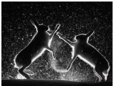
总冠军作品：雪中争斗