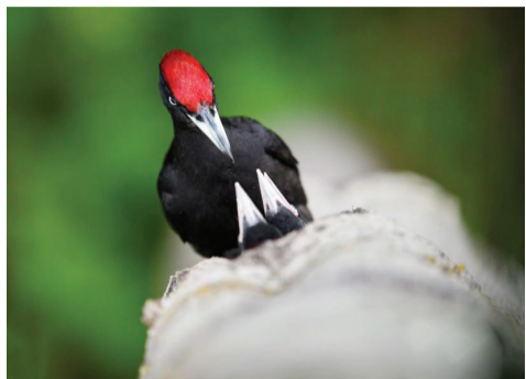
鸟类组荣誉奖：饥饿的喙