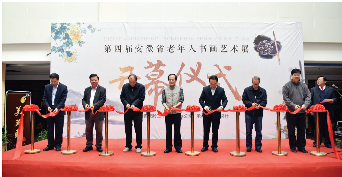
与会领导为此次书画展剪彩