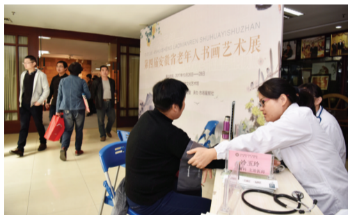
省针灸医院医生在现场义诊