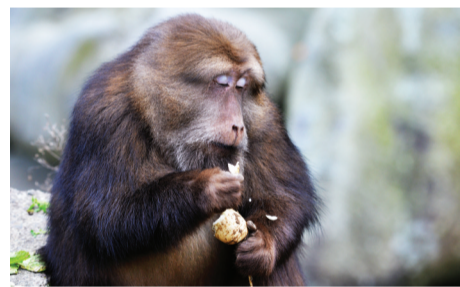
饥寒交迫时，偷吃萝卜。