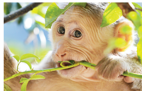
猴宝宝大多时间都在妈妈的怀抱里，稍稍长大，就能自食其力啦。