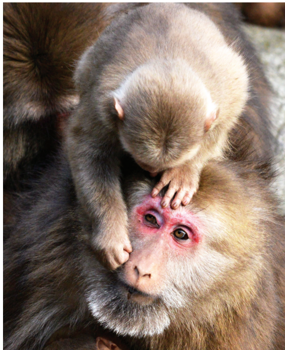
猴宝宝在给妈妈“理毛”。