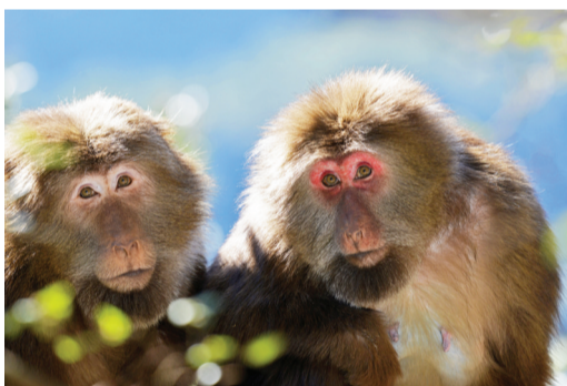
猴王和它的临时配偶(右)在一起。