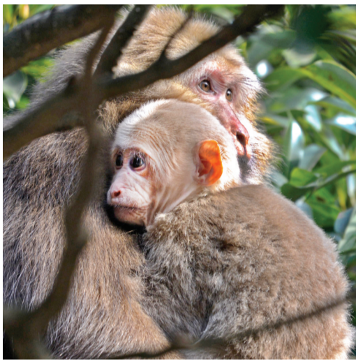
这只还没有生宝宝的青年雌猴将一只小婴猴抱到树上，体会当妈妈的乐趣。