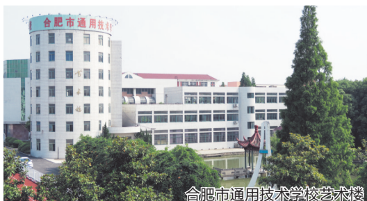
合肥市通用技术学校艺术楼