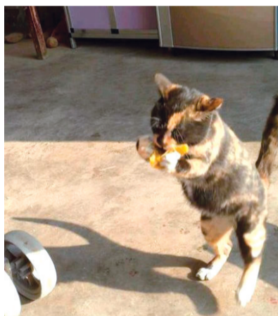
吃货，你这是要逆天了吗？