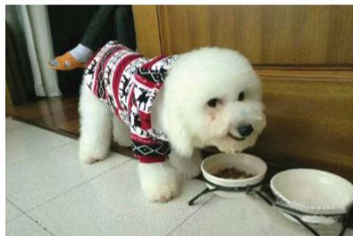
一只偷吃猫粮的家伙露出的迷之微笑