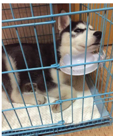
我就想问问你，今天的饭呢？