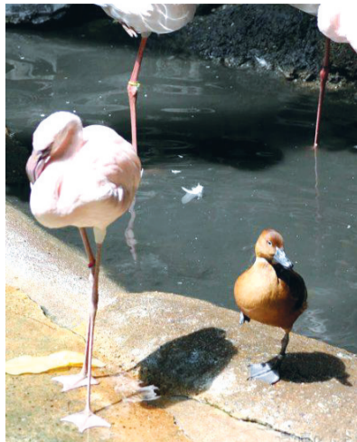
没人告诉你你只是一只鸭子吗？