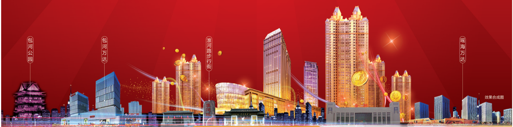
EVERGRANDE CENTRAL PLAZA