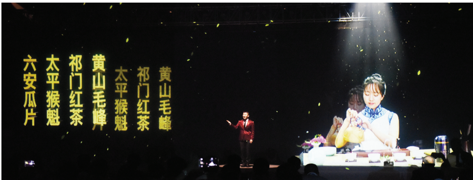
推介环节中,安徽第一次采用全息投影技术展示美好安徽

秀丽的黄山、神秘的九华、壮阔的巢湖……当大美安徽的自然风光和人文景观在六分钟之内,全景展现在你的面前,让你触手可及的时候,是怎样的奇妙体验? 昨日上午,在中部六省旅游推介暨发展论坛上,安徽的推介压轴登场,惊艳八方,用3D全息投影介绍的方式引爆了推介会。