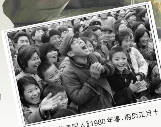
《快乐的凤阳人》1980年春,阴历正月十五,摄于小溪河村