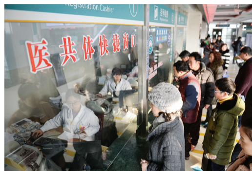
医共体快捷窗口