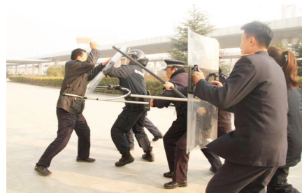
近日，合肥铁路公安处全椒站派出所组织辖区的职工、特勤人员针对春运期间旅客聚集、易发生暴恐袭击的特点开展反恐演练。确保辖区发生暴恐袭击时能快速、有效地处置，为“平安春运、有序春运、温馨春运”保驾护航。 ■ 黄明

“书香安徽阅读季”已成为安徽全民阅读推广活动的重点品牌，写入国家新闻出版总局“十三五”发展规划，正式列入“书香中国”全国重点品牌，形成“书香安徽”品牌效益，引领、示范带动安徽阅读活动的开展，正在成为安徽人的一种生活方式。