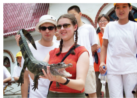
人类与扬子鳄和谐共处

旌德县确定了以“迈入高速时代、打造健康旌德”为主线，以到2020年全面建成小康社会为总目标，深入贯彻落实创新、协调、绿色、开放、共享五大发展理念，大力实施生态立县、民生优先、全域旅游、小县大城、创新驱动五大战略，以全域旅游战略为唯一产业发展战略，彰显开放发展理念，逐步形成“全域旅游+”的工作格局。