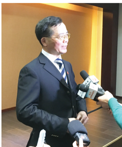
宣城市委书记韩军

提起宣城，大家首先想到的是山水之城、诗歌之城，在践行五大发展理念上，宣城在力推经济发展，扩大招商引资，但同时保护青山绿水，促进文化旅游产业上做了足够努力。