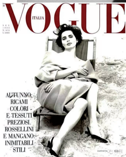
她成了那个年代收入最高的模特