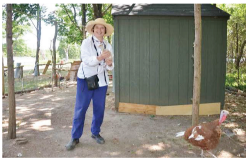
脱下高跟鞋做农妇

“当女人步入中年，那么这个世界对你便不再友好。你不够年轻又不够老，正处于边缘地带。”这句话，本来是一位母亲告诫女儿的话，很残酷却也很中肯。但这个女儿偏偏不信邪，人近中年才出道，在44岁失业又失婚，却在日渐老去时卷土重来，64岁活成了最美的农妇。她，就是伊莎贝拉·罗西里尼。