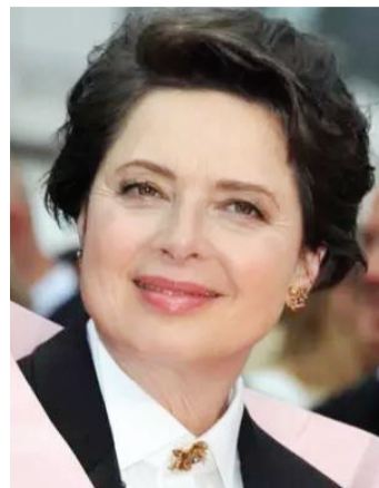
被电影节请去做评委会主席