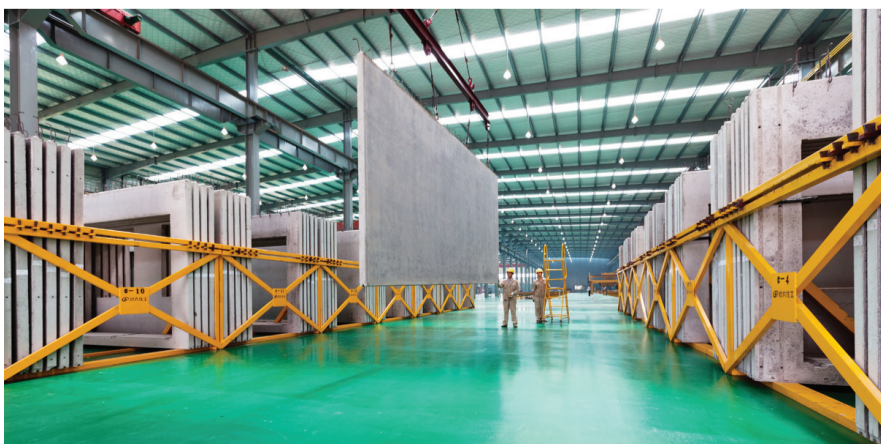
远大住工的PC生产工厂——所有建筑部品均在工厂生产完成