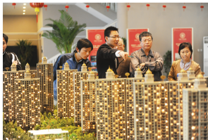
到现场看房 黄洋洋/图

5、2014年1月，合肥率先在全省实施公租房与廉租房“两房并轨” (统称“公共租赁住房”)。实现并轨运行、分档补贴、梯度保障，并根据国家及省要求，积极探索公租房建设管理新途径、新方法，推进公租房建设管理科学发展。2015年12月7日，安庆市棚户区改造工程一个具有划时代意义的日子。安庆市首张房票，标志着安庆城区房屋征收工作全面进入房票安置时代，政府平台代建还建安置房成为历史。