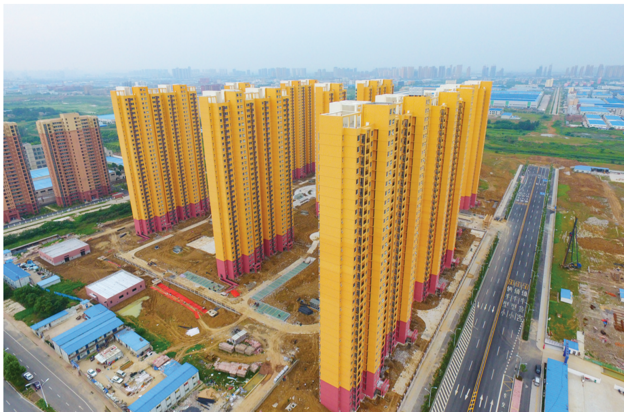
一栋栋住房拔地而起

民生为先，百姓至上，始终将保障和改善民生作为一切工作的出发点和落脚点，着力解决群众最关心、最直接、最现实的利益问题，追溯过去五年，看到的是民生事业发展中的一个闪光点。