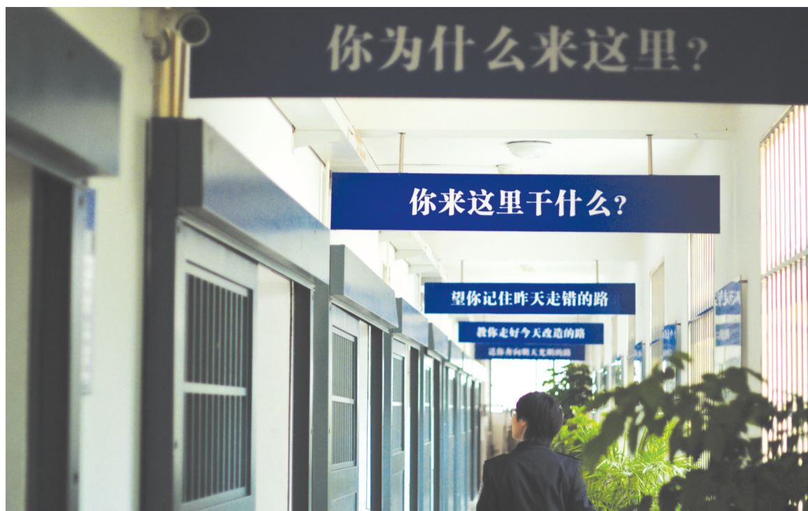
顽危犯管理中心内

安徽省白湖监狱管理分局(以下简称白湖监狱),是安徽省最大的罪犯教育改造基地,这里关押着1万多名服刑人员。在这其中,有着一些想着自杀、自残、越狱、捣乱的“刺头”分子,而这些人给周边服刑人员带来的消极影响无疑是巨大的。为此,白湖监狱于2014年8月成立顽危犯矫正训练中心,坚持“惩罚与改造相结合,以改造人为宗旨”的方针,将这些“刺头”集中起来管理。日前,市场星报、安徽财经网记者就在省政法委的统一安排下,来到这个神秘的顽危犯矫正训练中心,揭秘监狱“刺头”的教改故事。