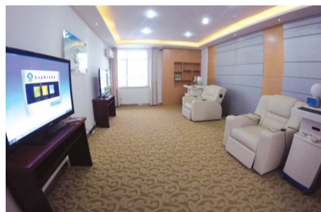
高科技心理矫正设备已应用在服刑人员身上