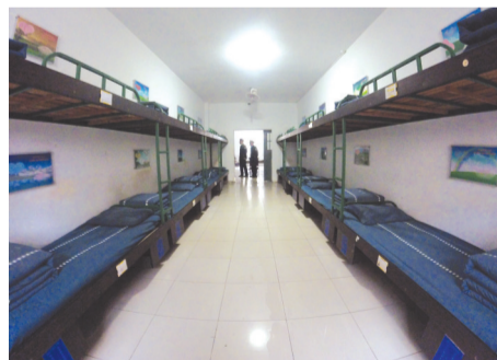
干净整洁的服刑人员宿舍