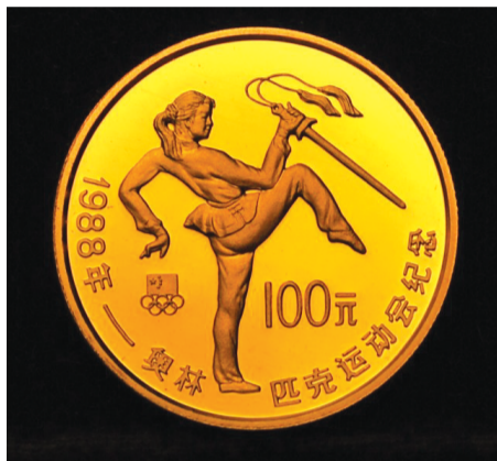
二分之一盎司金币 1988年发行的奥运会“女子武术”

在我国发行的各种现代金银纪念币中,奥运题材纪念币一直是一个很重要的收藏板块,具有很高的投资收藏价值。