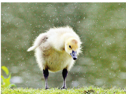
步步艰辛的小鸭子