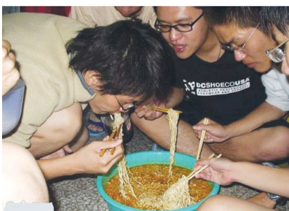
看谁吃的快,吃的多。