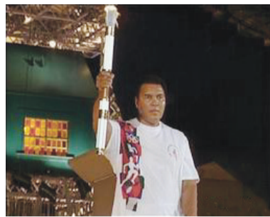
亚特兰大奥运会上点燃火炬