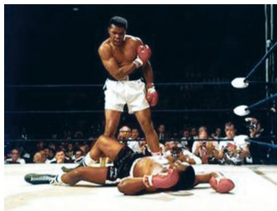
击倒种族歧视的一拳