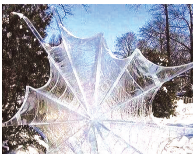
这个冰结的我给99分