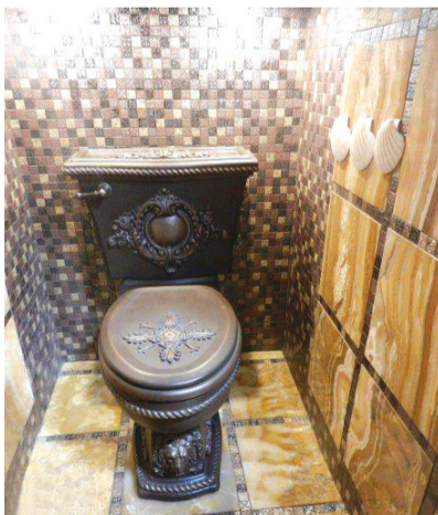
上个厕所觉得像是登基了