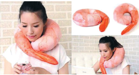
天冷了，该系围巾了