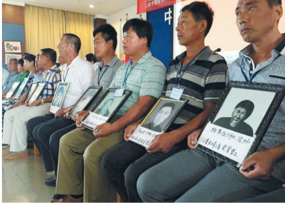
中国劳工遗属在发布会现场