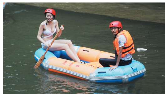
湖南景区现比基尼“护漂队”

7月19日,众多身着比基尼的美女与游客在湖南平江连云山体验刺激的漂流。当日,该景区为前来的单身游客推出比基尼“护漂”项目,比基尼美女与游客同船为其保驾护航。