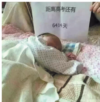
备战高考,从小做起