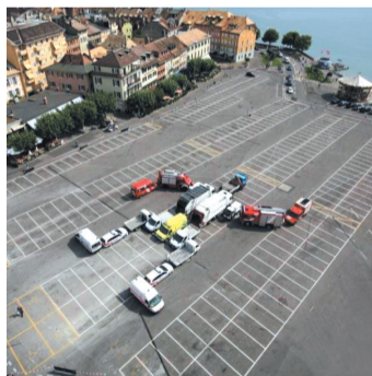
停车停的太有创意了