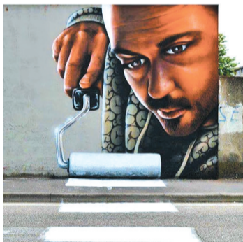
艺术大师是这样子画斑马线的