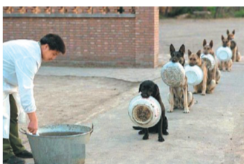
训练有素的军绿狗狗