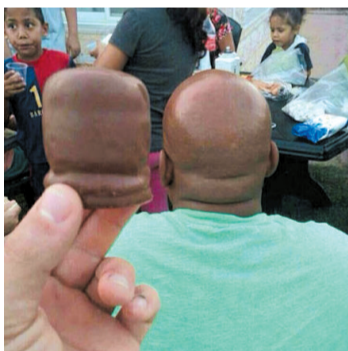
哈哈，找你的模子了