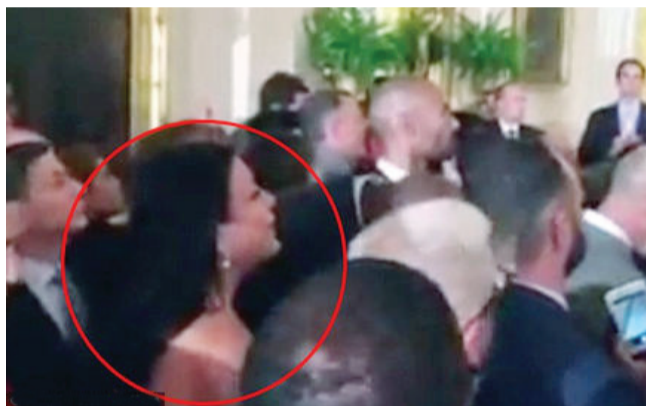
演讲现场(视频截图)