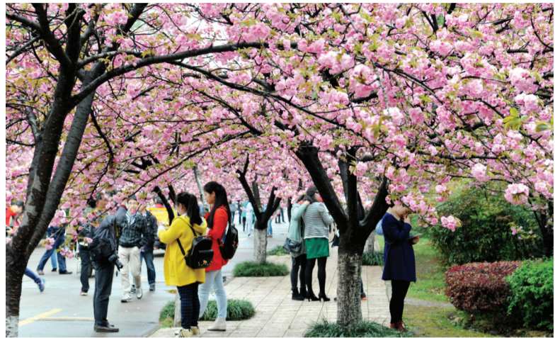
科大樱花雨中开放，粉红晚樱和“万红丛中一点绿”的绿樱，吸引了大量游客前往一睹芳容。但最吸引人的，莫过于东区北门口最为集中的樱花，100多株粉色晚樱，花瓣层叠如粉色云朵。 记者 倪路/图

不过警方却并不建议市民通过微博进行报警。“警方微博非报警平台，发现违法犯罪线索，或遇紧急警情，特别是涉及人身安全的警情，请及时拨打110报警，以免贻误最佳处置时机，不方便发声的情形下，可编辑短信发送至12110，警方会快速处置。”民警介绍道。