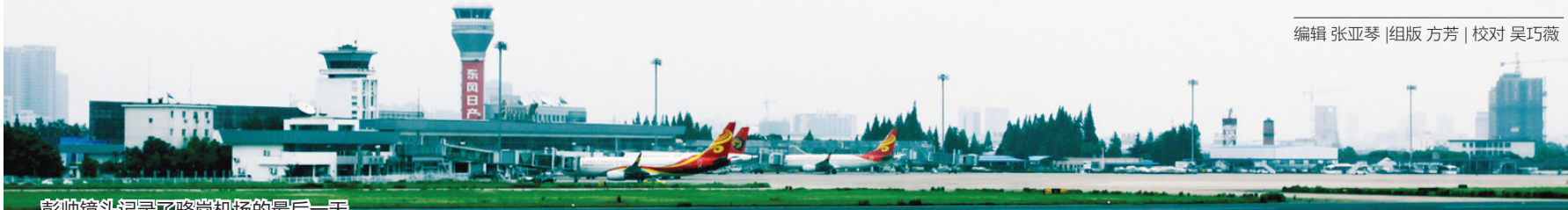
彭帅镜头记录了骆岗机场的最后一天