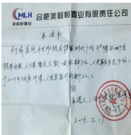
开发商去年2月份的承诺书