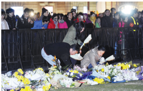
市民在踩踏现场追悼

综合新华社报道 根据上海市政府新闻办官方微博“上海发布”最新消息,上海外滩踩踏事件迄今全部36位遇难者身份已核实,名单均公布。