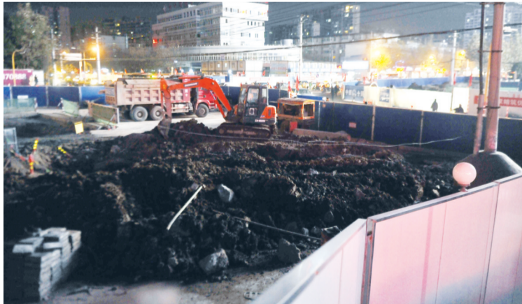
各类施工车辆已经进场

根据规划设计方案,地铁望江西路站位于望江西路与潜山路交口,为3号线、6号线换乘站,3号线车站沿潜山路方向布置,规划6号线沿望江西路布置。其中,地下一层为3号线与6号线共用站厅层,中部为公共区,站厅形成圆形公共区。地下二层为3号线站台层、6号线设备层。3号线站台层为长120m、宽14m的有效站台区。有