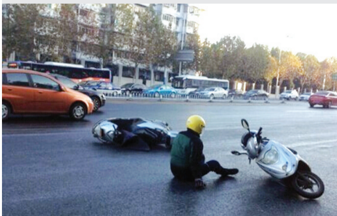
黄山路与桐城路交叉口