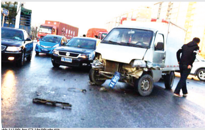
龙川路与呈坎路交叉口