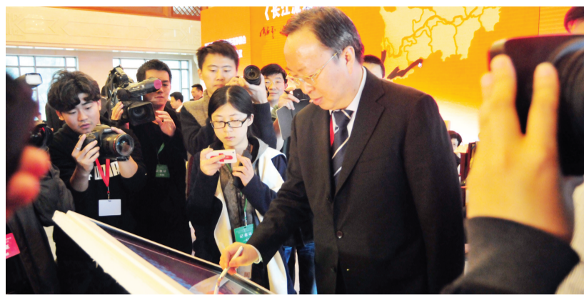
市长们在签署合作协议

协议实施后，各成员城市将在大气污染防治、地表水污染防治、地下水和土壤生态修复等领域提升合作层次与效益，共享科研成果，而一旦发生环境污染事件，跨区域的应急联动机制将启动，各成员城市将共同应对区域突发性生态环境污染问题。