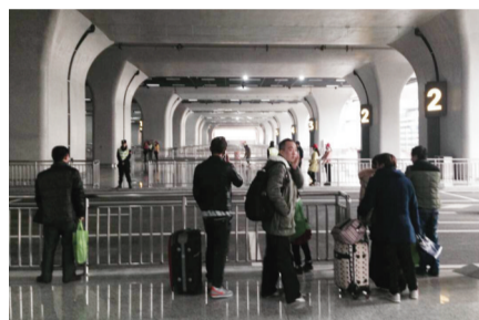
旅客在焦急地等待出租车