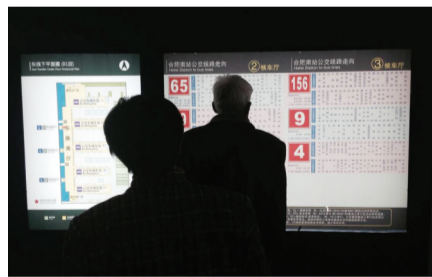
几条线路公交分布在两个候车厅