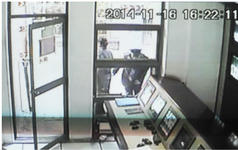
监控显示保安倒下瞬间