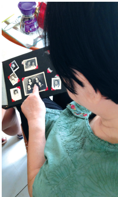
周奶奶在翻看中学时期的照片

她和同学的课外生活也十分轻松惬意,“五六个人凑点钱,去漓江边租一条船。”乘船游玩时,她们还可以顺便游泳。“约同学逛公园、爬山也是常有的事,十分轻松惬意!”