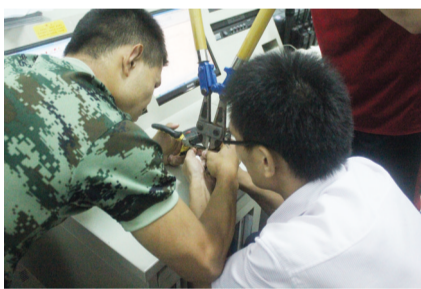
消防人员利用工具取男子手上戒指