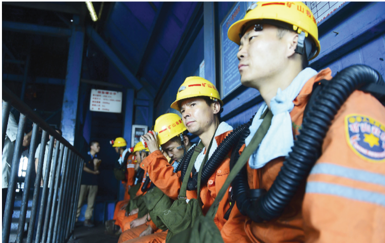
8月20日,刚从井下救援上来的国家矿山应急救援队队员坐在矿井口休整

淮南东方煤矿“8.19”事故救援工作依旧紧张有序。昨日,安徽省委书记张宝顺前往现场指挥救援,并赴医院看望了受伤的矿工。截至昨晚记者发稿时,救援队已达灾变区实施搜救。