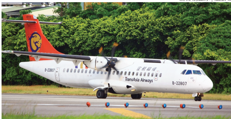
2010年7月在台北松山机场拍摄的复兴航空公司的ATR-72型客机