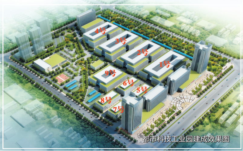
都市科技工业园建成果图