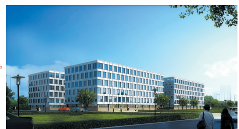
都市科技工业园标准化厂房