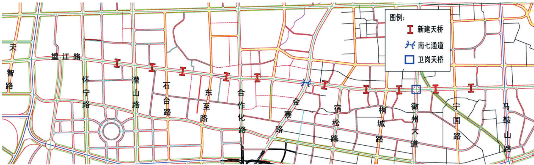
望江路将新建10座过街天桥

因为火车西站的阻隔，望江西路500米的“断头”存在了多年。日前，随着合肥火车站“挪窝”，望江西路下穿西客站工程也正式启动。昨日再次传来喜讯，8月5日起，合肥市规划局启动望江路(天智路-马鞍山路)工程方案公示，“4车道变身6车道”、“新增BRT公交站台”、“新建10座过街天桥”……等诸多设想浮出水面。