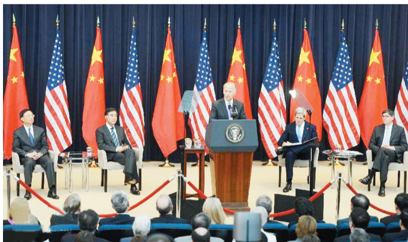
第五轮中美战略与经济对话开幕现场

在网络安全问题上，中方阐明了中国政府的原则立场，同意今年内再举行一次网络工作组会间会。双方积极评价中美战略与经济对话机制的重要作用，同意进一步完善这一机制。双方宣布建立元首特别代表热线。