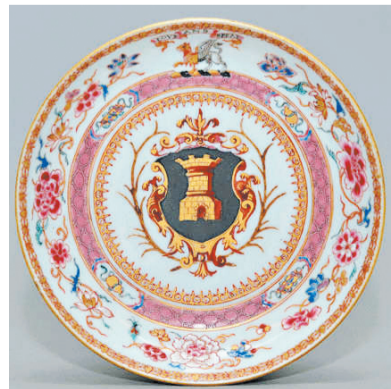
1728年城堡纹章瓷盘(藏友提供,未经鉴定)

早在2005年1月,佳士得拍卖行曾在纽约洛克菲勒中心举行过一场中国外销艺术品专场拍卖会,曾有一对十八世纪40年代烧制的带有菲利普五世纹章图案的纹章瓷,以30.72万美元的高价成交;同年,在伦敦的一场拍卖会上,一对18世纪的粉彩描金鱼形汤盆,以62.4万英镑的高价成交。这对汤盆近半米长,绘工精细,色彩艳丽,在鱼鳃处绘有西班牙贵族奥乔亚家族的徽