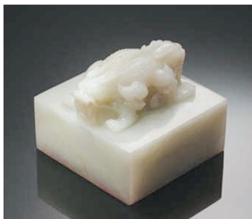
清乾隆御制白玉交龙钮玉玺拍出6670万元

在艺术品拍卖领域,明清瓷器和文玩杂项珍品可谓是仅次于名家字画的拍卖项目,历来追捧者众多,今年春拍亦是如此。纵观2013年瓷器杂项春拍行情,虽说没像前两年春拍时亿元拍品频现,但也不乏可圈可点之处。吴伟忠