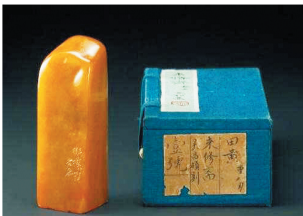
吴昌硕刻“来修齐田黄章”