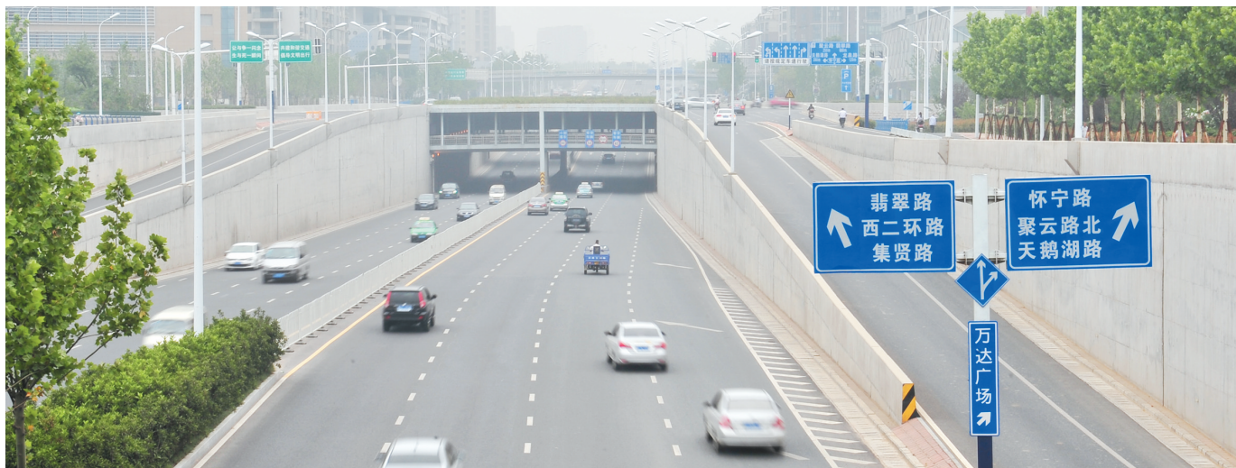
位于政务区的南二环快速车道

自马鞍山路高架(即南北高架)建成之后,其与南二环的对接也愈发快速,考虑到未来地铁站以及南二环和马鞍山路高架的整体互通能力,一座立交的需求自然不可缺少。