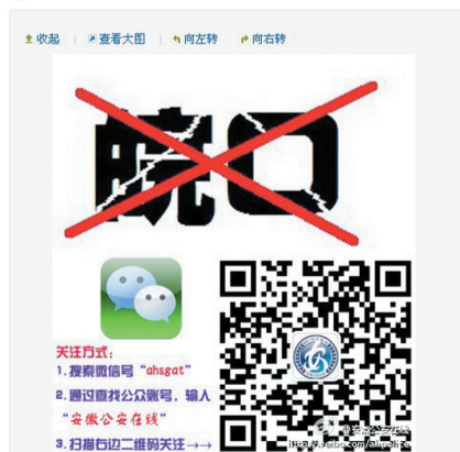
安徽公安在线微博截图

【安徽取消全省皖O专段号牌】为贯彻落实党中央、国务院、省委和省政府关于进一步加强公务用车管理有关规定。从4月起,我省将开展取消全省皖O专段号牌专项工作。此次专项工作针对全省范围内皖O号牌各类公务用车,7月1日后,全省不再出现皖O号牌公务用车。