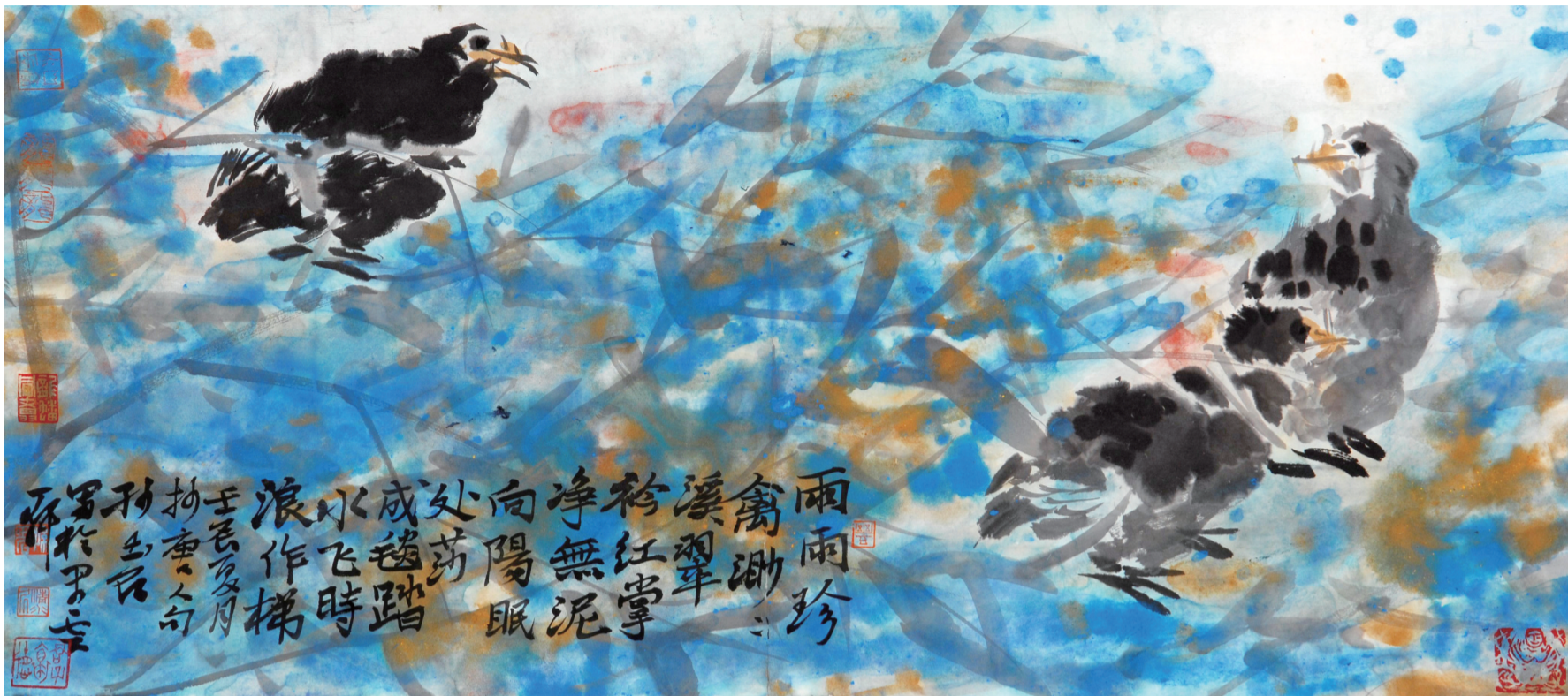
孙玉石:《雨雨珍禽渺》