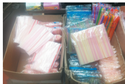
三无吸管公开销售

经过走访，记者发现市场上三无吸管在使用和销售环节，均比较常见。那么这些吸管是用什么原料制作的呢？他们对人体又有什么样的危害呢？对此，记者进一步展开调查。