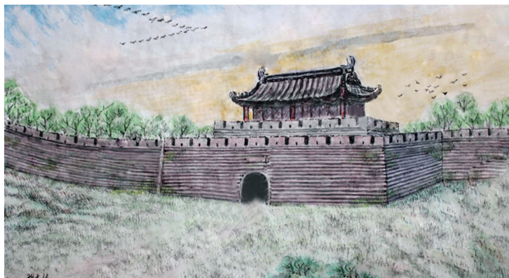
画家笔下的时雍门